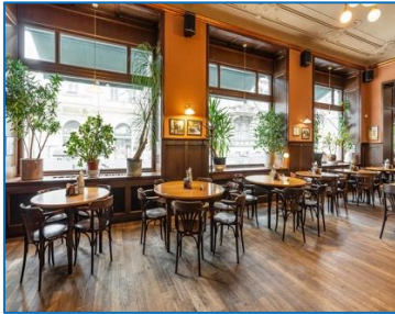
Foto 2 - Gastgarten - Eintritt