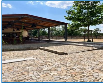
Foto 3 - Gastgarten - Ausstattung