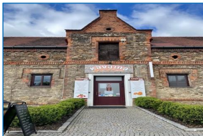
Foto 2 - barrierefreier Eingang