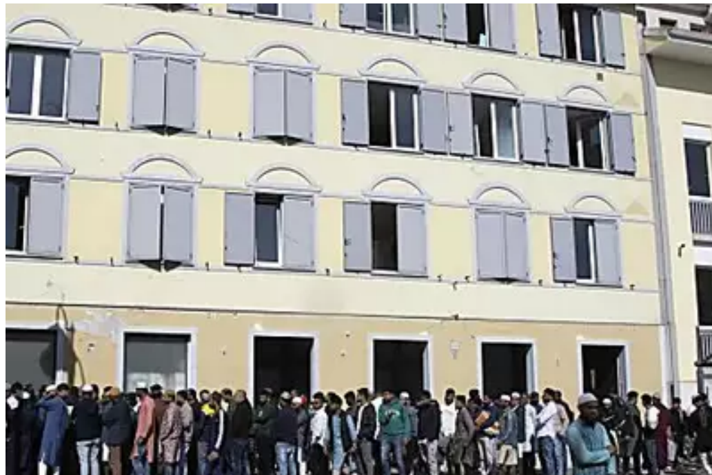
In fila a Monfalcone per la preghiera del Ramadan: attesa la sentenza sull'ex Hardi